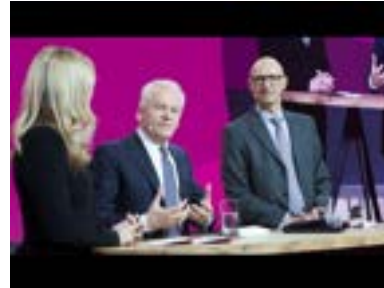
Telekom CEO Tim Höttges