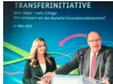
Bundewirtschaftsminister Peter Altmaier